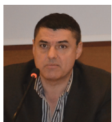
В'ячеслав Володимирович Камінський, д.мед.н., професор, член-кореспондент НАМН України, головний позаштатний спеціаліст з акушерства і гінекології МОЗ України, виконавчий директор ААГУ

порівнювати їхню роботу і підкреслює ще раз, що акушерсько-гінекологічна спільнота в країні сьогодні є прогресивною частиною лікарського товариства. Сьогодні ви демонструєте ту позитивну керованість, яка дозволяє у міністерстві розуміти, що нині ми абсолютно логічно наблизилися до того, щоб підтримати пілотний проект, створити нову модель дій асоціації та її впливу на місцях. З метою розвитку напряду лікарського самоврядування ми прагнемо передати асоціаціям частину повноважень щодо профе-